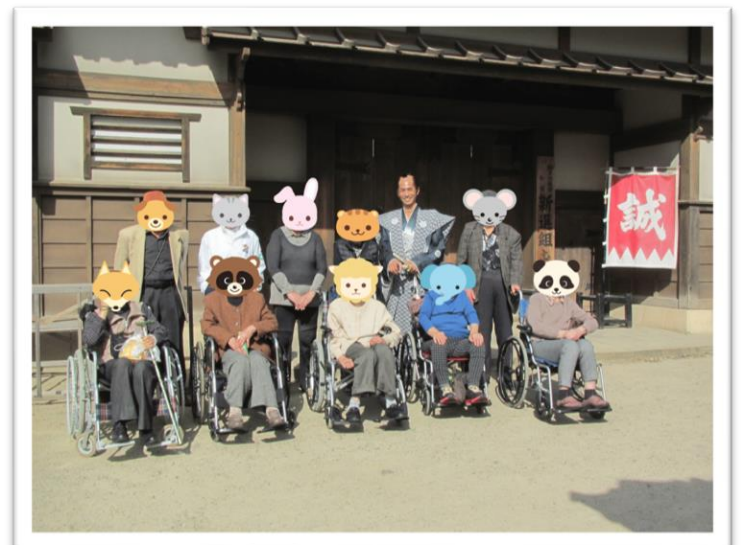
太秦映画村にて 2024年